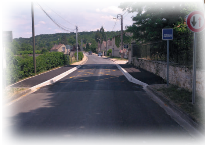
L'arrêt de bus

En janvier des travaux importants ont été réalisés dans le hameau de Challeau. Objectif : rendre les trottoirs aux piétons.