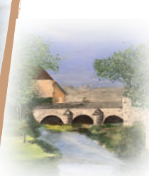
M. Frot : Le pont de la Selle