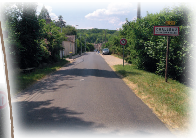
L'entrée de Challeau et le parking (à droite)

En effet, depuis longtemps, les véhicules stationnaient sur les trottoirs, obligeant les piétons (notamment les écoliers) à marcher sur la chaussée au péril de leur sécurité.