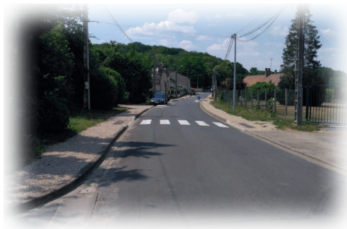
Au carrefour de la Rue de la Garenne

Depuis longtemps, les administrés de Challeau s'inquiétaient de la vitesse excessive des véhicules traversant le hameau. Consciente de cette réalité, après étude et consultation des services du département, la municipalité a décidé d'entreprendre des travaux de mise en sécurité (cheminement des piétons, mise aux normes de l'arrêt de bus et aménagement de places de stationnement), avec obligation de respecter les normes départementales.