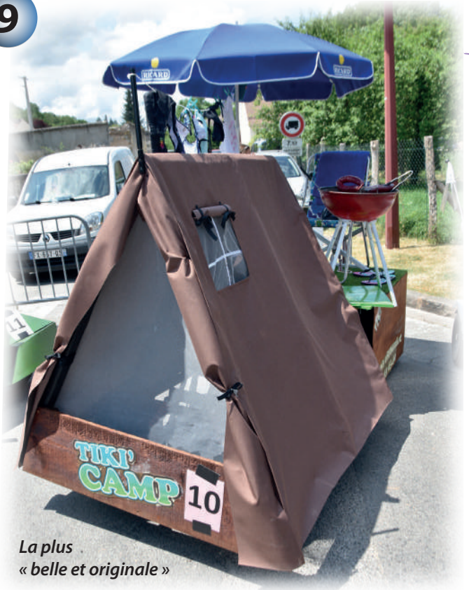
La plus « belle et originale »