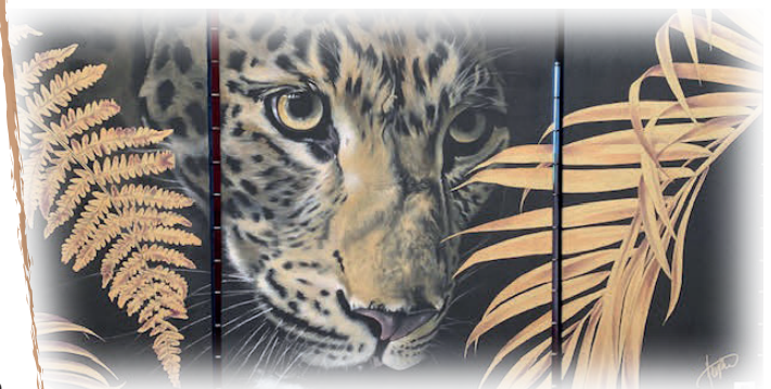
Séverine Herpin : Instinct (tryptique)