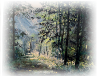
B. Tassigny : Promenade estivale

C'est Mireille Ratte qui, à l'issue du traditionnel vote organisé à l'occasion du vernissage, a remporté l'adhésion du public pour son tableau «Automne ». Un public très nombreux, témoin du succès de cette exposition de pas moins de 143 œuvres, accompagnées de textes des écrivains de Callipages.