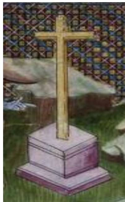
Détail d'une enluminure d'un manuscrit du XV e siècle, illustrant l'Histoire de Guiron le Courtois (Ms. Français 3477 - Paris, Bnf)