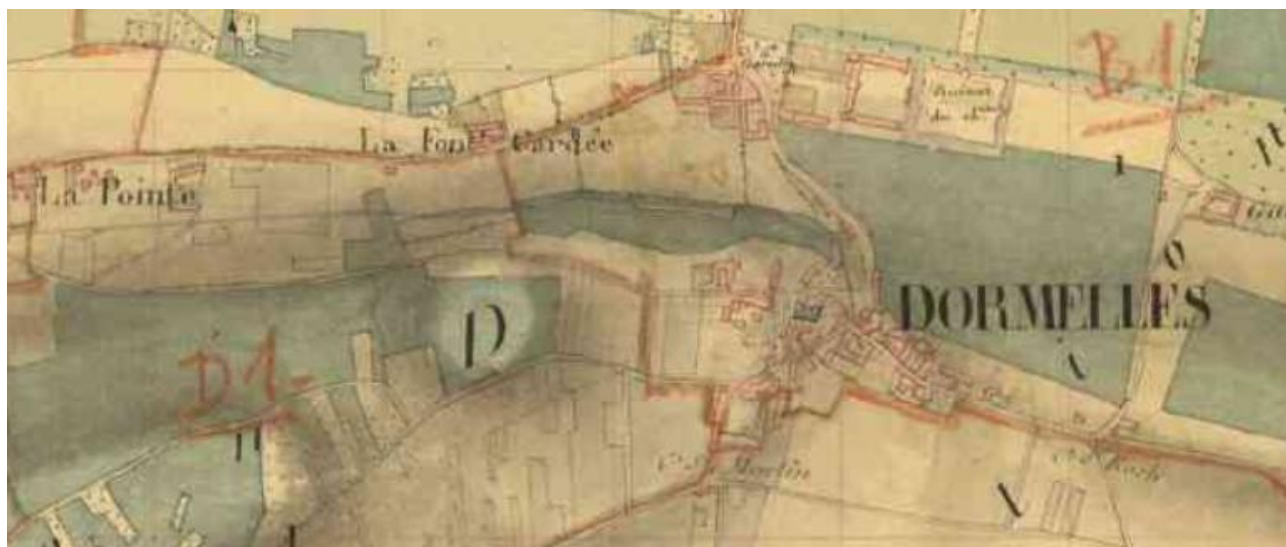
Cadastre général parcellaire « napoléonien » (1824-1926), extrait du tableau d'assemblage

Le lieu d'implantation de cette croix a été remis au jour grâce au cadastre napoléonien de 1824 qui indique sa position au carrefour de la rue des Vignes Basses, de la Route de Villemaréchal et du chemin de la croix Sainte-Anne, dénommé aujourd'hui « allée des Noyers ».