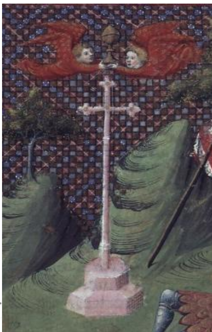
Détail d'une enluminure d'un manuscrit du XV e siècle, illustrant l'Histoire du saint Graal (Ms. Français 117 - Paris, Bnf)