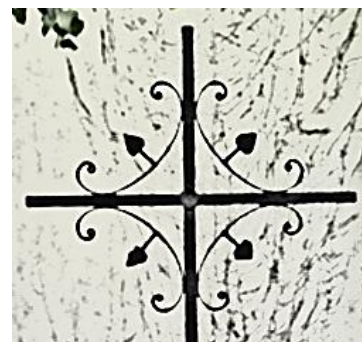
La croix après restauration

La « nouvelle croix » est marquée du millésime de 1863, ce qui permet de situer la fabrication de l'objet dans le temps. Elle porte, en outre, la mention : « F.P.M » correspondant à l'abréviation de : « fait par moi ». Ces trois lettres, séparées par des points, sont encore bien lisibles sur la hampe de la croix. Plus loin, les lettres : « E.P.D » gravées dans le fer, correspondent, selon toute vraisemblance, aux initiales des nom et prénom du maréchal-ferrant concepteur de l'œuvre.