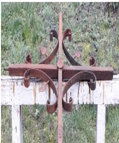
La croix avant restauration

L'objet a été remis en état par des membres de l'association. Il consiste en une croix latine de section carrée, pourvue de crossettes dans les écoinçons et ornée de quatre fers de cœurs 3 . La croix a perdu, aux extrémités de la traverse et de la hampe, ses ornements d'origine (palmettes ? boules ?). Ignorant la forme de ces motifs et, par souci de préserver l'authenticité de l'œuvre, la restauration s'est arrêtée avant d'inventer toute création hypothétique.