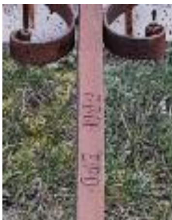
La mention : « F.P.M » suivie des initiales « E.P.D »