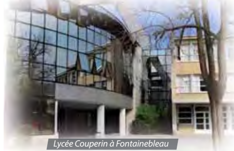
Lycée Couperin à Fontainebleau

Nils : Je suis au lycée Couperin à Fontainebleau et pour m'y rendre, il n'y a qu'un seul bus le matin et un seul le soir. Quand je termine plus tôt, je suis obligé d'attendre au lycée. Ça serait bien que nous ayons deux bus le matin ou deux le soir, pour nous permettre de rentrer plus tôt en fin de journée car rentrer tous les soirs à 19h chez soi, c'est fatiguant, surtout l'hiver.