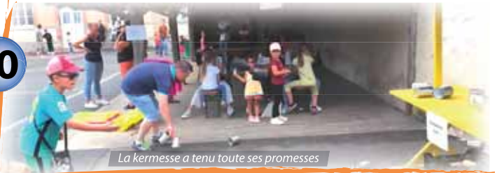
La kermesse a tenu toute ses promesses

Le dimanche 10 septembre a eut lieu notre brocante annuelle. Dès 6h00 du matin, les chineurs étaient déjà sur place pour attendre les exposants. Une fois ceux-ci installés, les négoce pouvaient commencer : 50 courageux avaient prévu de débarrasser